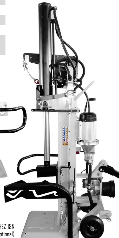
Modell HEZ-18N mit Seilwinde (optional)