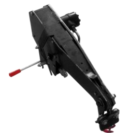
Seilwinde(2), mechanisch (optional für Modell HEZ-18N)