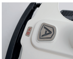
Stoßsensor zur Hinderniserkennung