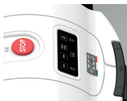
Bedienfeld mit LED