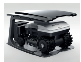
Roboter in der Ladestation (Abdeckung optional erhältlich)