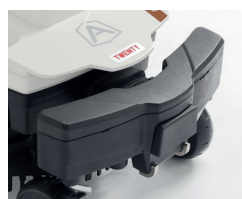
Stoßsensor zur Hinderniserkennung